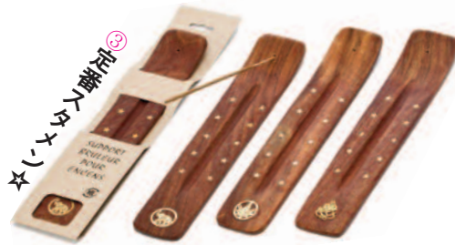
ゾウ リーフ ガネーシャ