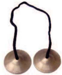
☆ ティンシャ ・スタンダード ミニ (径40mm) =¥1,530【1双】