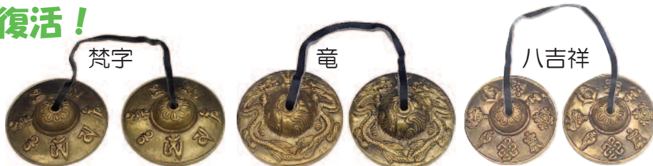
⑦ 金色ティンシャ・S/径65mm=各¥3,900【1双】