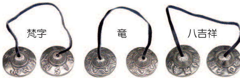
☆ ティンシャ・新SSS/径42mm=各¥3,150【1双】