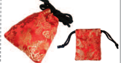
☆ SSサイズ/径46mm用 =未検品 ¥840【1】 85x65mm