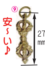
⑨ミニ五鈷杵 《A-4》 = ¥150