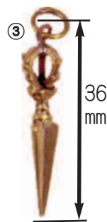
③ミニ 独鈷杵 = ¥910