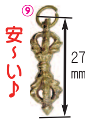
⑨ミニ五鈷杵 《A-4》 = ¥150