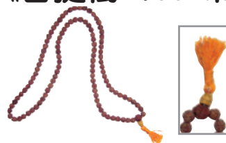
☆ 8mm珠=¥1,680 内周 75~85cm