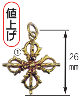
①ミニ カツマ = ¥1,300