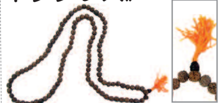
☆ 12mm珠=¥2,380 110cm