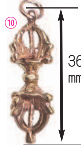
⑩ミニ五鈷杵 《A-5》 = ¥810