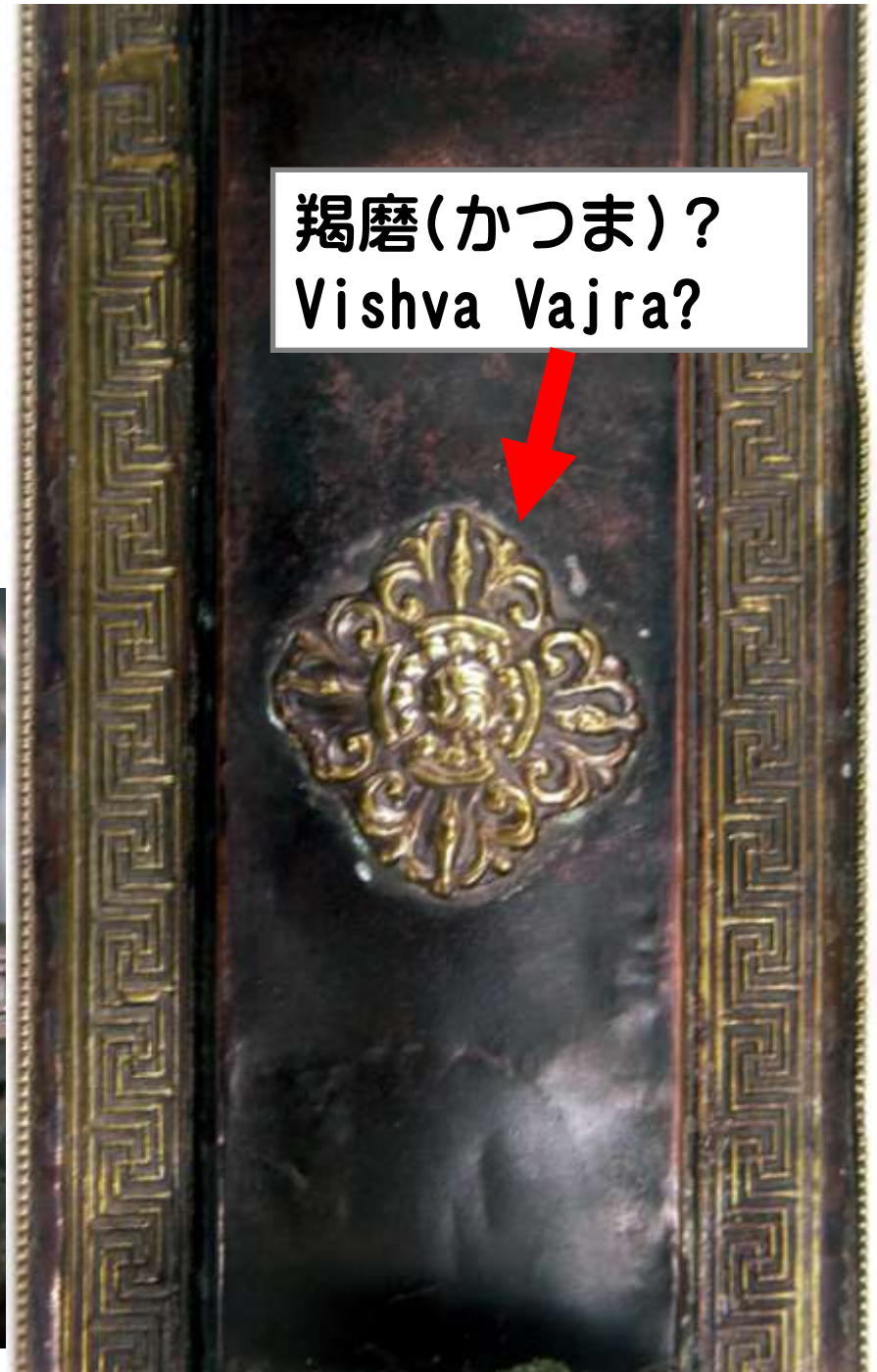
羯磨(かつま)? Vishva Vajra?