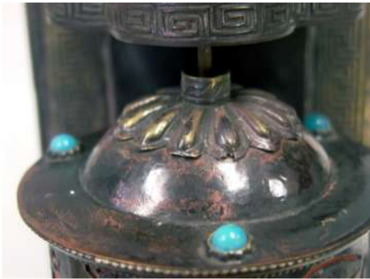
ラーメンマーク、もとい 雷紋。 Chinese Meander (Thunder)