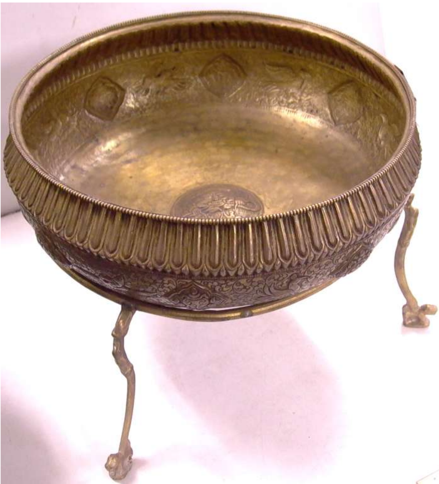
K o t a A with Legs